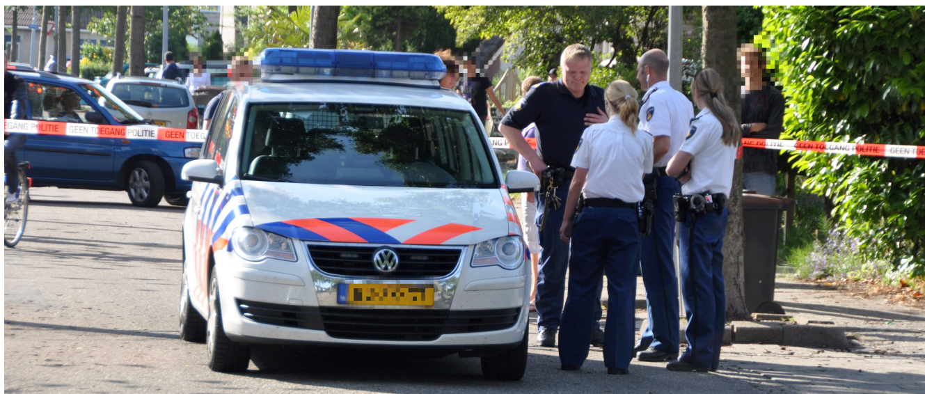
Buurtonderzoek heeft niets opgeleverd.

Naadorp - Na enkele weken zonder voortgang heeft de politie het onderzoek naar de kluisroof bij Dhr. Rand gestaakt.